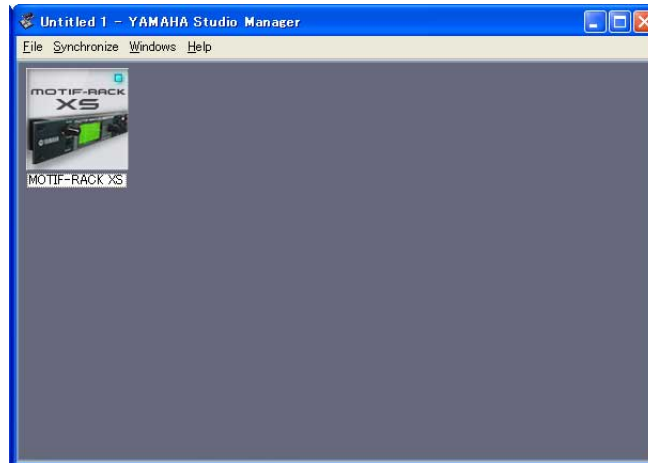
Fenster von Studio Manager

Doppelklicken Sie im Studio-Manager-Fenster auf das Symbol von MOTIF-RACK XS Editor.